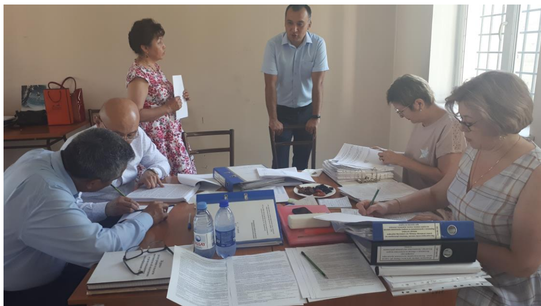
2 сурет. ССК мүшелерінің құжаттаманы зерделеуі

1 сурет. Орталық қызметінің негізгі бағыттары туралы Презентация