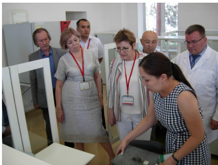
3 сурет. Орталықтың зертханаларына бару