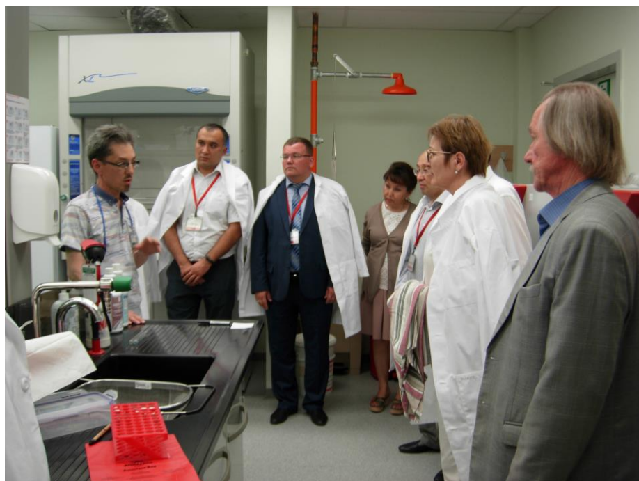
4 сурет. Орталықтың зертханаларына бару